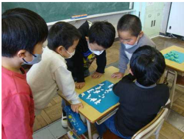
図工「ねんどでおみせやさん」