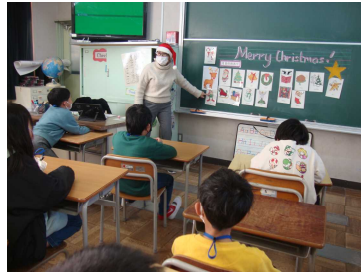
英語活動「クリスマス」