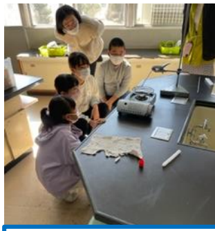
4年生理科 安全に実験! 変化を見逃さないぞ!