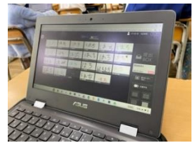
タブレットは、考えを共有することや、一人一人の考えを大切にすることにとても役立ちます