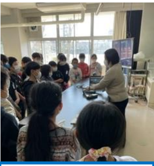
4年生理科 実験の手順をよく確認して