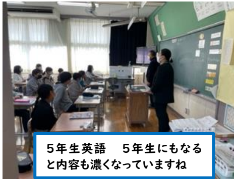
5年生英語 5年生にもなると内容も濃くなっていますね