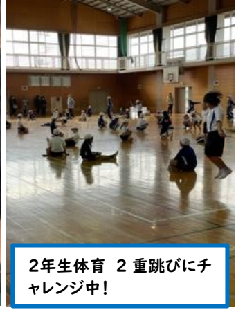
2年生体育 2重跳びにチャレンジ中!