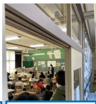
5年生国語 人に伝わりやすい文章を考えました