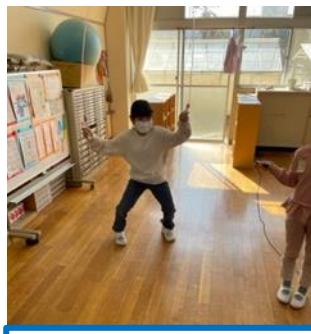
5年生 いろいろな跳び方ができるようになったよ!