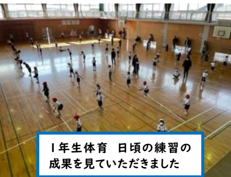
1年生体育 日頃の練習の成果を見ていただきました