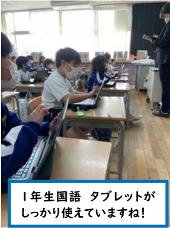
1年生国語 タブレットがしっかり使えていますね!