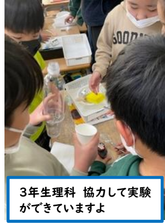
3年生理科 協力して実験ができていますよ