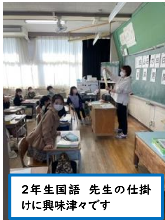
2年生国語 先生の仕掛けに興味津々です