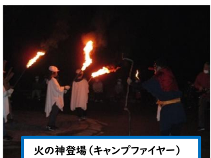
火の神登場(キャンプファイヤー)