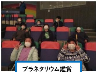
プラネタリウム鑑賞

11月15日(火)～16日(水)にかけての1泊2日、5年生の林間学校が東毛青少年自然の家を中心に実施されました。5年生にとっては、初めての集団宿泊学習でしたが、大きなケガや病気もなく、予定していた内容をすべて順調に行うことができました。皆で楽しむときと儀式等で引きしまるときのメリハリがしっかりとでき、5年生の成長の跡が感じられました。また、時間に気を付けて行動することができたので、予定通りの活動が余裕をもってできました。担任の先生からも、引率の先生からも、施設の人からもたくさん褒められた林間学校になりました。今日は5年生の活動様子を写真でお知らせし、楽しかった林間学校を皆で共有したいと思います。