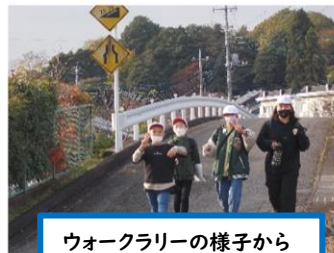
ウォークラリーの様子から