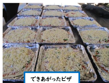
できあがったピザ