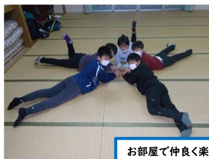
お部屋で仲良く楽しく