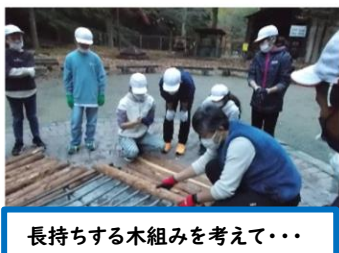
長持ちする木組みを考えて・・・