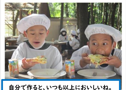
自分で作ると、いつも以上においしいね。

これまで、学校のサブリーダーとして、登下校の班長や交通少年団のあいさつ運動、運動会での係など、活躍の場が増えてきた5年生です。もうすぐ学校のリーダーになりますね。期待しています。