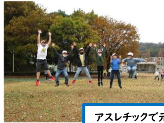
アスレチックで元気に遊びます