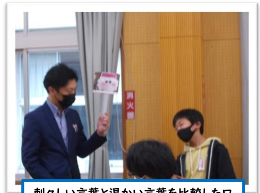
刺々しい言葉と温かい言葉を比較したロールプレイに協力していただきました。

普段の何気ない生活での会話において、配慮が足りずに不快な思いにさせてしまったり、言い方によって誤解を招いてしまったりということがあります。子どもが、心配事があって相談したときや、ちょっと励ましてほしいと思って話したときに、親や先生が素っ気なかったり、愛情が伝わらなかったりして、子どもが傷ついてしまったらたいへん残念なことですね。今回の学校保健委員会の活動から、改めて子どもへの言葉かけを通して愛情を伝えていく大切さを感じ、身が引き締まる思いがしました。また、お忙しい中ご参加いただいた多くの保護者のみなさん、ありがとうございました。