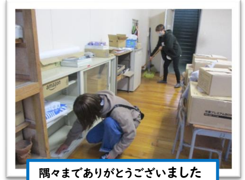
隅々までありがとうございました

12月6日(火)の放課後に、PTA環境部のみなさんに校内の環境整備をしていただきました。今年度から児童数は減りましたが、建物自体は変わらないため、子どもたちの各清掃場所の人数がへりました。それでも子どもたちの頑張りのおかげで、清潔な校舎が保たれています。しかしながら、学年室など、普段清掃できてない場所もあるため、今回は環境部のみなさんにご協力いただきました。手際よく、短時間にとってもきれいにいただきました。ありがとうございました。