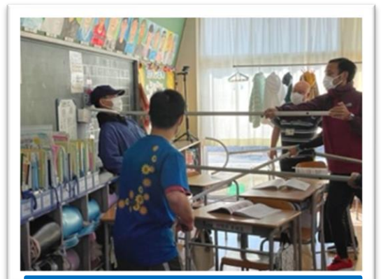
駆けつけた教職員が不審者(役)を取り押さえる