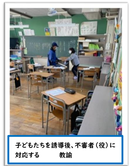
子どもたちを誘導後、不審者(役)に対応する 教諭

笠小では、防犯カメラを16カ所設置して職員室のモニターに常時映るようにしていますが、学校という性格上、人の往来を常にシャットダウンしておくことは難しいです。そのため、教職員も子どもたちもその意識を高めておくことが大切であると考えます。今回は、そのためのよい機会になったと思います。在校中や登下校中に犯罪に巻き込まれるようなことがあってはならないことを、全員が自覚する日となりました。