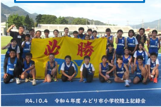
R4.10.4 令和4年度 みどり市小学校陸上記録会

よう頑張ることを期待しています。また、出場はしなくても記録会に向けてチャレンジした人もいました。陸上記録会に向けて練習に取り組んだすべてのみなさんに称賛の拍手を送りたいと思います。来年度以降も水泳記録会や陸上記録会は実施されます。5年生以下のみなさんも、自分の素晴らしさを発揮できるよい機会となりますので、その時になったら、ぜひ多くの方がチャレンジしてほしいと思います。