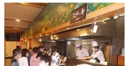
ステーキは一人一人焼いてくれます 「ホテル三日月」で・・・

6年生の皆さんには、修学旅行全体をとおして学んだことを生かし、先生たちとも力を合わせてよりよい笠懸小学校づくりに貢献してほしいと思っています。