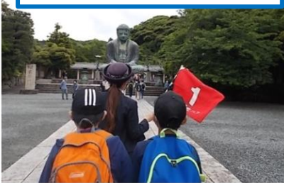
鎌倉大仏から班別行動スタート

さて、1日目の鎌倉班別行動では、それぞれの班の計画にしたがって行動することができました。集合場所の鶴岡八幡宮では、皆が満足そうな表情で見学したものや買ったものなどの話をしてくれました。海ほたるや宿泊場所のホテル三日月でも子どもたちの楽しそうな表情や行動を見ることができ、「本当に実施できてよかった」と感じました。