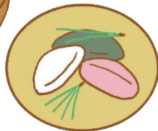
松餅 (ソンピョン) かんごく 【韓国】

じゅうごや、ひがし 東アジア各地でも祝われます。中国では「中秋節」、韓国では「秋冬(チュソク)」といいます。また、英語では9月の満月を「ハーベスト・ムーン」というそうです。