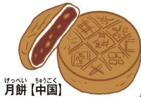
げっぺい ちゅうごく 月餅【中国】