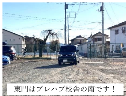
東門はプレハブ校舎の南です！

懸案だった笠中の校門から银杏並木までの歩車分離がようやく前進しました。8年前から市に要望していたので、長年の要望が実現した形です。笠小は東に校門がなく、笠中の校門を使用していますが、職員や保護者様の自動車も同じ経路を通過して学校に入ってきます。狭い笠中の校門付近や银杏並木は「いつ事故が起きても不思議ではない」と要望し続けていました。特に、朝8時頃は登校する児童と通勤する職員が集中しますので、今まで事故がなかったのは運がよかったのだと思います。写真左下のような状況は改善されましたが、休み時間や下校時には、関係団体や取引業者の車両が通行しますので、引き続き子どもたちには注意を呼びかけていきます。保護者様につきましても、登下校時はできるだけプレハブ南の東門のご利用をお願いいたします。