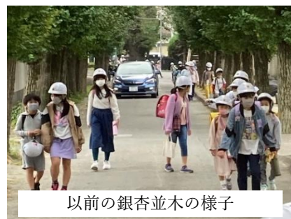
以前の银杏並木の様子