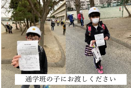
通学班の子にお渡しください